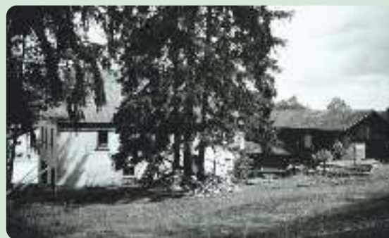
Obere Mühle Weischlitz, 1938

Die Mühle verarbeitete Getreide und diente mittels Wasserkraft auch als Sägewerk. Heute wird das bestehende Gebäude als Wohnhaus genutzt.