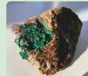
Pseudomalachit auf Quarz

Feinkörniger Diabasmandelstein und Tentakulitenschiefer wechselt mit Knotenkalk, in dem man mit etwas Glück ammonitenartige Fossilien finden kann. Vorrangig wurden die zum Rittergut gehörenden Steinbrüche auf Kalk zu Bauzwecken abgebaut.