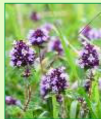
Gemeiner Thymian

Weiter entfernt vom Weg (Fernglas) kann im Hochsommer im Bereich des Lambziggrundes der seit dem Mittelalter geschätzte Heilziest (Arznei-Betonie) bestaunt werden.