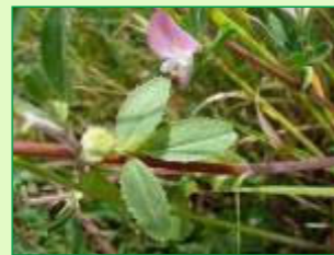
Kriechender Hauhechel

Vorbei am Großen und Kleinen Weidenteich wird das NSG erreicht und es eröffnet sich der Blick auf die offene Heidelandschaft. Auffällige Silikatfelskuppen aus vulkanischem Diabas prägen die Hütellandschaft. Überall entlang der Wegstrecke sind zu sehen: Kriechender Hauhechel, Gemeiner Thymian, Wiesenflockenblume, Heide-Nelke, Stengellose Kratzdistel und als wertvolle Arzneipflanze das Johanniskraut.